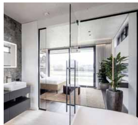
Plovoucí dům je exkluzivní, vysoce kvalitní a jedinečný.