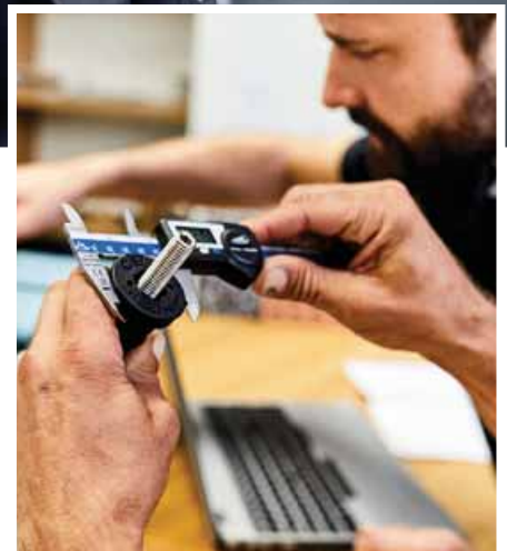
Nejvyšší kvalita na všech úrovních zaručuje nejlepší výsledky.

V inovacích, jak říká firma Celo, se prosazuje jako vedoucí společnost ve svém oboru. Inovace je v Celo psána s velkým „I“ a je chápána jako nepřetržitý proces, který vyžaduje neustálou pozornost a práci. V jejich inovativní továrně jsou