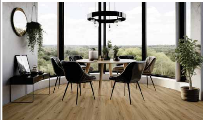
S NOVO SPA dub Macadamia vytvoříte i v jídelně příjemnou atmosféru.