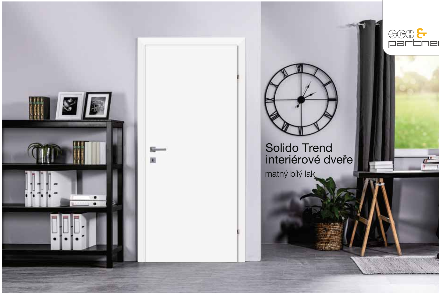
Solido Trend interiérové dveře matný bílý lak