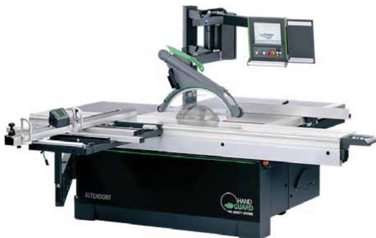
Formátovací pila ALTENDORF HAND GUARD - unikátní systém včasné detekce rukou v pracovním prostoru se dvěma kamerami chrání nejen vás a vaše zaměstnance, ale také vaše zakázky a finance.

Rozšířený sortiment: Nedávné rozšíření sortimentu přináší řadu dalších možností, jak zvýšit efektivitu výroby a tím i zhodnocení vaší produkce. Díky rozsáhlé nabídce vám nabízíme řešení šitá na míru vašim individuálním potřebám. Nechybí ani nabídka v oblasti servisních služeb jako údržba, opravy strojů a nabídka náhradních dílů. Naše komplexní služby vám zajistí spolehlivý a dlouhodobý provoz vašich zařízení.