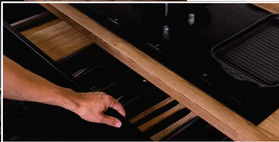
Díky obzvláště plochému odtahovému potrubí nabízí model Kristall možnost používat úložný prostor pod varnou deskou i nadále jako zásuvku.