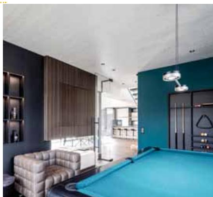
Legendární kulečnickový stůl 247 má svůj vlastní salonek v domě Floating House.

Zhruba o 20 let později převzal tesařství Ari Griffner a vznikl Griffnerhaus. S Floating House vstupuje firma do nové dimenze a chce oslovit i mezinárodní zákazníky. Společnost Schachermayer je již dlouholetým partnerem firmy Griffnerhaus v oblasti interiérových dveří. Naše interiérové dveře budou instalovány také v novém exkluzivním domě Floating House.