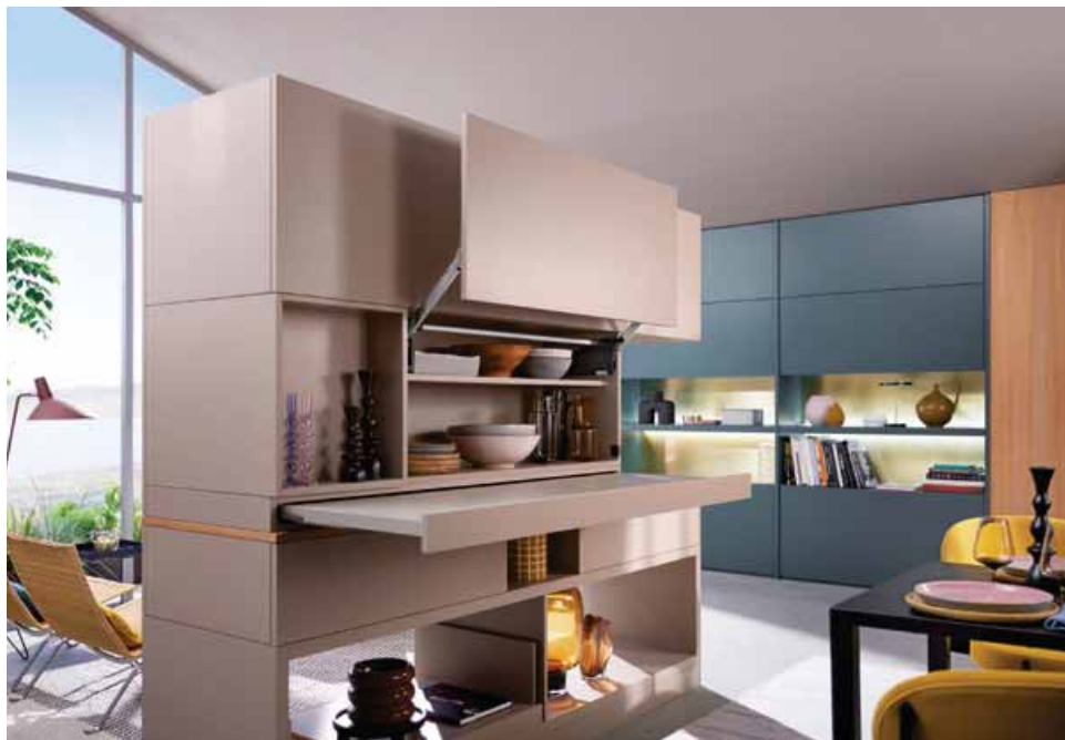
Výklopy se kováním Aventos HL top jsou vhodné pro skřínky umístěné nad pracovní plochou a na pracovní ploše.

Technologie Blumotion zaručuje plynulé a tiché zavírání a plynulý doraz udržuje čelní plochy přesně tam, kde je chcete mít. Ovládání je jako sen: montáž bez použití náradí, trojrozměrné nastavení čela a symetrické páky. Aventos HL top zajišťuje jednotný design tím, že elektrické spotřebiče skrývá za průběžnou čelní plochu. Harmonický vzhled dotváří elektrická podpora otevírání, která reaguje na lehký tlak a stejně jemně se zavírá stisknutím tlačítka.