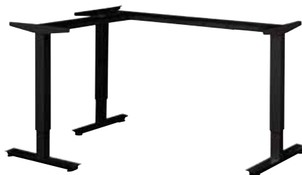
Podnož VERTEX Ergo elektricky výškově stavitelná 680-1180mm, síla zdvihu do 120kg (při plošném zatížení).