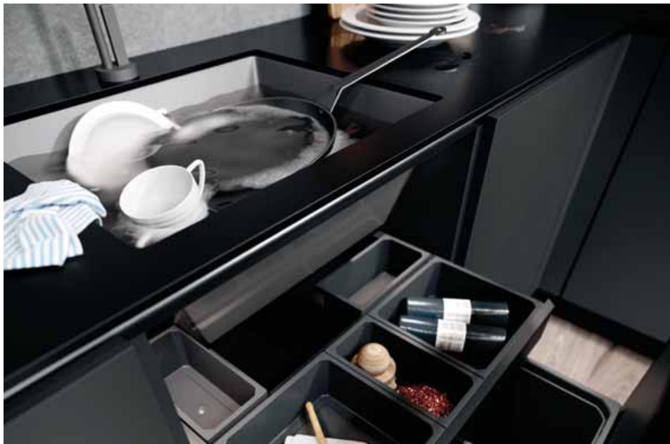
VS ENVI® Space nádoby zavěšené v plném čelním výsuvu. Organizační modul VS ENVI® Drawer doplňuje řadu VS ENVI® Space inovativním využitím prostoru.

čela VS TAL® Larder má integrované tlumení a samozavírání. Pro otevřené dvěře skříní je vhodný rám VS TAL® Gate.