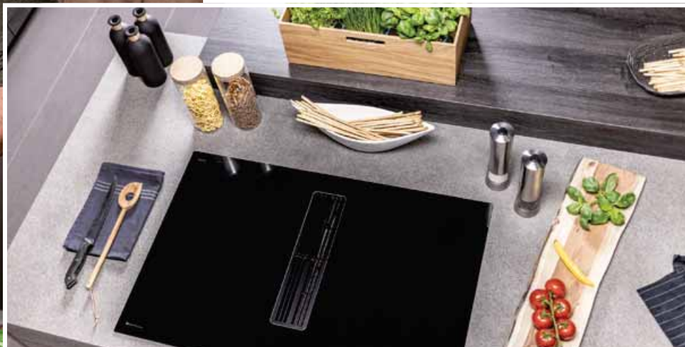
U integrovaného odsavače par Saphir lze výkonný motor umístit individuálně – do podstavce nebo na jiné místo