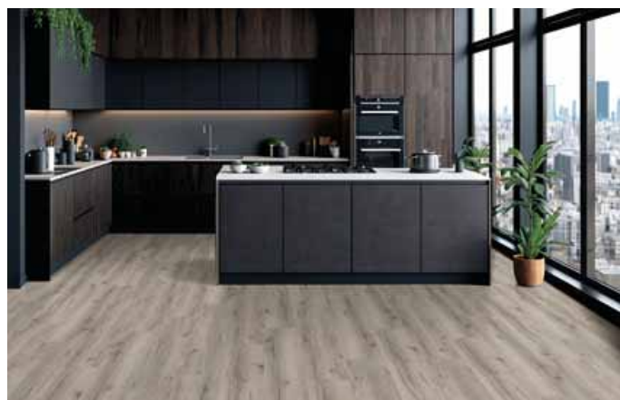
Dekor dub Dolomit perfektně pasuje k modernímu designu ve tmavých kuchyních