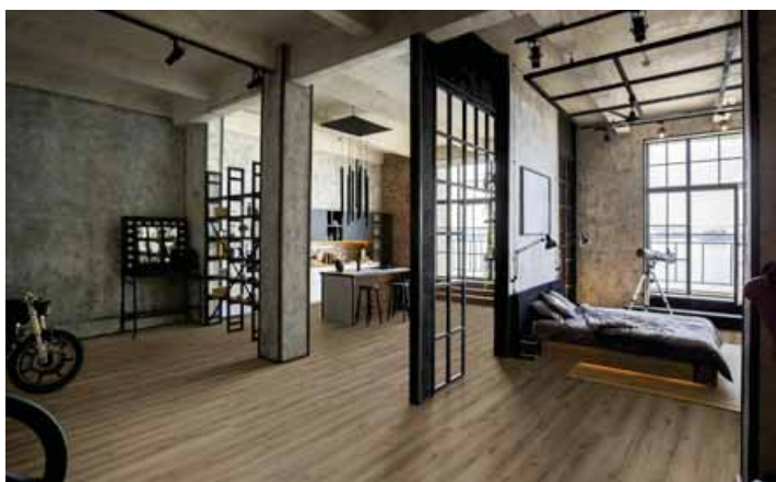
NOVO SPA dub Viktoria zabezpečuje plynulé přechody v celém domě

K dyž se někde bydlí, zanechává to stopy. V domě plném života se pořád něco rozlévá, něco se pokape, na podlahu padají předměty nebo tu řádí domácí mazlíčci. A přesně tak to má být, člověk si ale nechce stále dělat obavy o podlahu. A s Rigid Board neboli také Rigid Vinyl ani nemusí, protože díky lakovanému povrchu, který je odolný