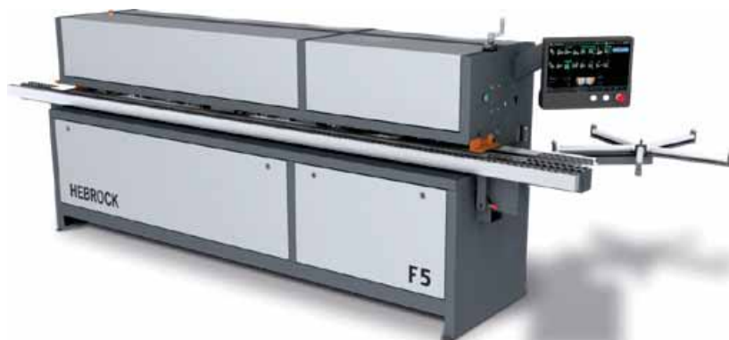
HEBROCK F 5 vyrábí hrany, které splňují a dokonce překračují nejvyšší požadavky. To nejlepší možné opracování hran, které vám náš model „vše v jednom“ spolehlivě poskytne.