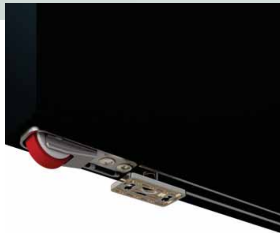
Špičkovou kvalitu a bezchybný provoz zajišťuje také konstrukce ve spodní části dveří.

Společnost Terno Scorrevoli se etablovala nejen jako značka, která představuje vynikající kvalitu a hodnotu, ale také jako průkopník řešení orientovaných na bu-