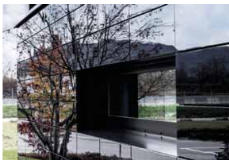
Každá jednotlivá skleněná dlaždice je neviditelně připevněna k domu pomocí patentovaného procesu.

Tento dům je klasikou od prvního dne,“ je přesvědčen Georg Niedersüß, jednatel společnosti Griffnerhaus. Floating House byl představen na začátku roku a už samotná fakta jsou působivá: okna od podlahy až ke stropu, monumentální vstupní dveře o výšce 2,64 m a šířce 1,70 m a možná výška místností až 5,85 m. „Dům je plovoucí,“ říká architekt, „a je to tak.“