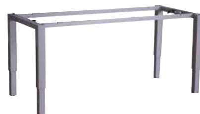
Podnož 4-LEG Strong elektricky výškově stavitelná 680-1180mm, síla zdvihu do 80kg (při plošném zatížení).