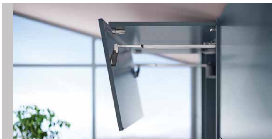
Díky integrovanému omezovači úhlu otevření nenaráží čelní plocha na strop a vytváří více úložného prostoru.

Aventos HF top přináší revoluci v designu a funkčnosti vysokých a středních horních skříněk. Toto inovativní kování umožňuje působivé vyklápění s dvoudílným předním čelem, které jsou nejen vizuálně přitaž-