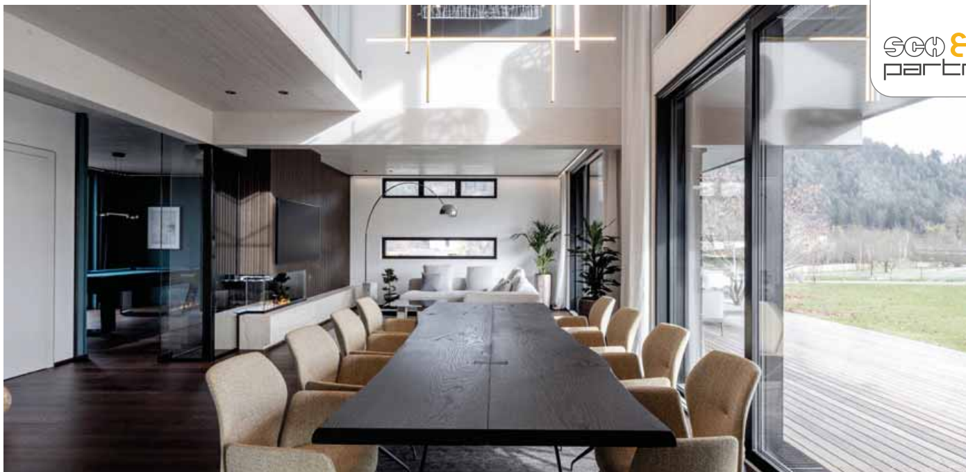
Výška místností až 5,85 metru a okna od podlahy ke stropu navozují v ukázkovém domě o rozloze 220 metrů čtverečních pocit nekonečné a absolutní svobody.

Okna od podlahy ke stropu jsou instalována ve stěnách již z výroby, nadrozměrné vstupní dveře mají asymetrické těžiště a uvnitř volně plovoucí schodiště s průběžným skleněným zakončením poskytuje ještě větší pocit svobody a prostoru. Tradiční firma začínala v roce 1950 jako truhlářství: Georg Siutz, strýc autora Petera Handkeho, stavěl krovky a sruby.