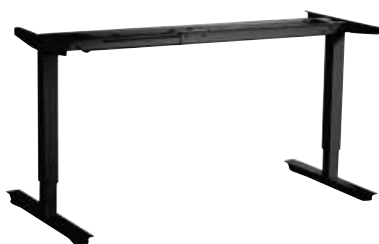
Podnož EXPANDER elektricky výškově stavitelná 680-1180mm, síla zdvihu do 100kg (při plošném zatížení).