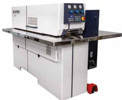
KUPER FLI, bestseller z široké škály strojů KUPER na spojování dých, kombinuje inovaci a osvědčenou technologii.

Okamžitě dostupné stroje: Mnoho z našich vystavených strojů bylo a je ihned k dodání, takže můžete své projekty zahájit bez zbytečných prodlev.