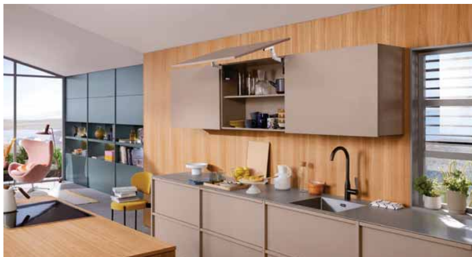
Kování na výklopy AVENTOS HS top v horní skříňce navozuje pocit beztlíže