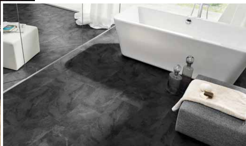
Podlahy jako ELEGANTO SPA břidlice Natur jsou velmi dobře vhodné do vlhkých prostorů, jako jsou koupelny nebo toalety.

proti nečistotám, a stabilní prostřední vrstvě představuje Rigid Vinyl optimální řešení pro všechny, kteří žijí naplno.